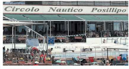
Circolo Nautico Posillipo