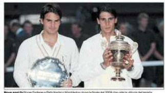
Nadal e Federer a Melbourne. Federer è il vincitore del titolo di Wimbledon 2017. Nadal è il vincitore del titolo di Wimbledon 2016.

Due giorni di emozionanti match a Melbourne per la conquista del primo slam della stagione. Federer e Nadal, la sfida più bella