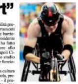
Strutture e mezzi pubblici adeguati per loro

aggregato quasi cento strutture di laboratorio con un tetto confermato di oltre 2 milioni e mezzo di prestazioni. Per chiarire la "rete contratto" l'attuale aggregazione richiesta dalla legge nazionale, unifica l'interlocuzione con la Regione, garantisce l'autoregolazione sanitaria dei laboratori aggregati. E ancora, applica il già riconosciuto accreditamento istituzionale, assicura la copertura dell'offerta e la sicurezza della prestazione, salvaguardando migliaia di posti di lavoro, «inoltre, il "rete contratto" modifica l'indotto per i piccoli e medi lombi, assicura con il mantenimento della rete analitica in capo a tutte le angelo strutture, la professionalità del biologo e del patologo clinico, ottimizza con applicazioni documentarie l'economia di scala. Assicura, in qualsiasi condizione, la sicurezza e l'interoperabilità del campione. Tutto questo a costo zero. Solo le presidenze, più spaziosamente accollati da parte di importanti Regioni. Le "reti controllo" oggi costituite in Campania, anche sotto l'egida di Fedebio, hanno già