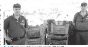
La Finanza con un blitz sequestra 300 chili di mitili

Le attività, svolte con l'aiuto del personale tecnico e sanitario della Asl Napoli 1 Centro, hanno consentito di accertare che l'impianto sotto accusa era privo di qualsiasi autorizzazione; le condizioni sanitarie ed igieniche erano decisamente precarie e, infine,