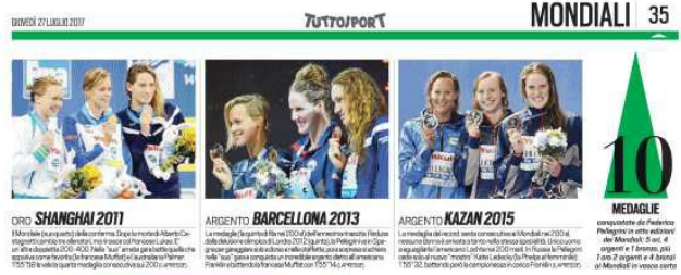
IL PERSONAGGIO Le mille rinascite dell'eterna Fenice Da 13 anni sulla breccia, pensionando tutte le rivali

Tutti s' inchinano. Dal presidente del Coni -amico Giovanni Malagò che la premia sul podio, rimproverandola per l' annuncio dell' addio ai 200 («non devi dire queste cose») ma esaltandola («sei la