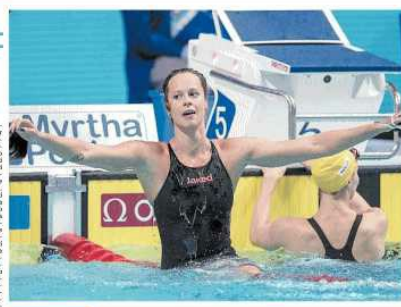
Nuoto Due ori e un bronzo in una giornata storica per la nazionale azzurra Grande Italia in vasca a Budapest Pellegrini, Detti e Paltrinieri show Fantastica doppietta di Gabriele e Greg negli 800 stile libero

L'evento Il primo italiano a vincere un oro mondiale in acqua. Pellegrini, 29 anni, è il primo italiano a vincere un oro mondiale in acqua.