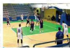
Un momento dell'incontro di Confronto tra Napoli e Battipaglia

CAVALINOVIO DI NAPOLI. Seconda vittoria consecutiva per