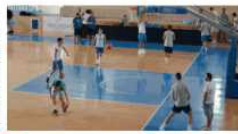
Gli allenamenti del Cuore Napoli a Torchiara

NAPOLI. Presage con il mini-torì di Agropoli fino a martedì prossimo, la preparazione pre-campionato, del miglior Cuore Napoli Basket, che disputerà a partire dal prossimo 1° ottobre per la prima volta nella sua storia, il campionato di serie A2 - girone Ovest. Agli ordini di coach Francesco Ponticello, con la collaborazione degli allenatori Franco Trotano e del preparatore fisico Chiaro, captain Maggio e compagni continuerà a svolgere le attività di allenamento al PalaCintia di Torchiara, a qualche chilometro dalla cittadina e cittadina fra parte fisica, con piscina e altro, il svolta invece all'Efysium for you di Agropoli. La prima amichevole, per il nuovo team del Cuore Napoli Basket, è prevista per il prossimo 30 agosto (probabilmente alle 19) al PalaBalthasar con il Vesuvio (B maschi), con l'incarico devoluto alle popolazioni ospite del territorio di Ischia. Assegnati anche i numeri di maglia tutti i gio-