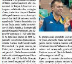
Paltrinieri fa suoi anche gli 800. Uomo e gli spadisti subito eliminati

NAPOLI. È un giovedì che sorride all' Italia, quello vissuto ieri alle Universiadi di Taipei. Gli azzurri ottengono infatti altre due medaglie d' oro, portando a cinque il bottino della spedizione azzurra. A conquistare i due titoli di ieri sono stati la squadra del fioretto femminile, che in una finale senza storia ha travolto (45-25) la Russia, e il sempre più grande Gregorio Paltrinieri, che dopo aver dominato i 1500 stile libero ha fatto suoi anche gli 800, superando in un testa a testa entusiasmante l' ormai tradizionale rivale Romanchuk. Le gioie azzurre, tra l' altro, non si sono fermate ai due ori, perché l' Italia ha conquistato anche altrettanti argenti (con Elena Di Liddo nei 100 farfalla di nuoto e con Irene Siragusa nei 100 di atletica leggera), e due bronzi: nei tuffi, grazie a uno splendido Giovanni Tocci, che nella finale del trampolino dai tre metri si è arreso solo ai fortissimi russi Zakharov e Kuznetsov; nel taekwondo, grazie all' ottima prova di Daniela Rotolo, nella categoria dei 62 kg. Il poco ci è mancato che anche un atleta campano potesse mettersi al collo una medaglia, bissando quan-