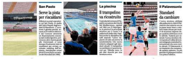
IL MATTINO NATIONALE 23 GENNAIO 2017 - TEMPO 23/01/17 22:46