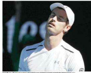
Andy Murray 20 anni, il numero 1 del ranking per il tennis professionistico

Allarme all'Open Sono spariti i n.1 Eliminati agli ottavi Murray e la Kerber Dei big restano i "vecchi" Federer e Nadal Il tennis di Melbourne è stato un torneo di prim'ordine. Il numero 1 del mondo, Andy Murray, è stato eliminato agli ottavi di finale dalla tedesca Angelique Kerber. Anche la numero 2, la spagnola Garbiñe Muguruza, è stata eliminata agli ottavi dal numero 10 del mondo, il ceco Tomáš Berdych. I due big del tennis, Roger Federer e Rafael Nadal, sono invece andati in semifinale. Murray e Kerber erano i favoriti per vincere il torneo, ma il sorteggio è stato sfortunato per loro. Federer e Nadal sono stati abbinati a giocatori meno quotati, il che ha permesso loro di avanzare in semifinale. Il torneo di Melbourne è stato il primo di un ciclo di quattro tornei che si disputano in Australia, con il Grande Slam di Melbourne che si disputa il 15 gennaio.