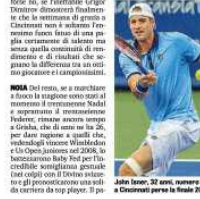
Nicola Pietrangeli, 32 anni, numero 18 a Cincinnati per la finale 2016