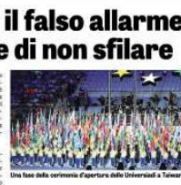
Una foto della cerimonia d'apertura delle Universiadi a Taiwan

La cerimonia di apertura delle Universiadi a Taiwan è stata una delusione per molti. La Cina ha deciso di non sfilare, e la cerimonia è stata ritardata a causa di scontri fuori dallo stadio. La cerimonia di apertura delle Universiadi a Taiwan è stata una delusione per molti. La Cina ha deciso di non sfilare, e la cerimonia è stata ritardata a causa di scontri fuori dallo stadio.