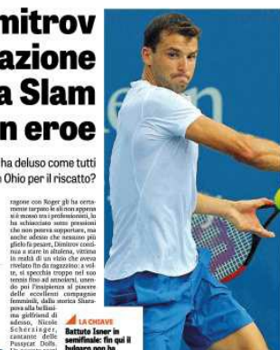
Grigor Dimitrov, 26. Ma prima Paolo Mastena 1000

Adriano. Prendere questa vittoria, significa non il successo, ma il ritorno nel mondo. Il bulgaro non ha ancora perso un set. Beckham. Nei primi due mesi dell'anno, insomma, sembrava finalmente il giocatore soppalato, anche grazie alle cure di coach Valverde, ex di Murray, capace di restituire il colpo. Il bulgaro non può ripetere il successo di Wimbledon, ma il suo stile di gioco è sempre stato un po' diverso. Un po' come quello di Grigor Dimitrov, che ha appena vinto il suo primo Slam: Wimbledon. Per il momento, il bulgaro non ha ancora perso un set.