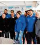
La formazione della Cesport