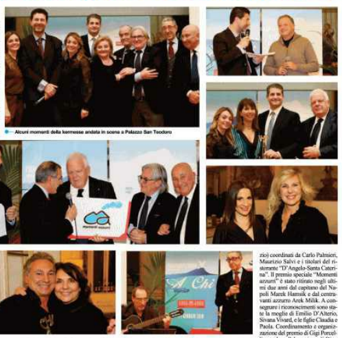
Alcuni momenti della kermesse andata in scena a Palazzo San Teodoro