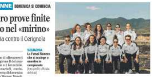
La Futsal Rionero in campo

Il basket lucano si prepara per l'inizio della stagione. I tecnici hanno lavorato molto per l'allestimento di una promovisiva a 10 squadre. I raduni regionali di arbitri e ufficiali di campo sono stati molto fruttuosi.