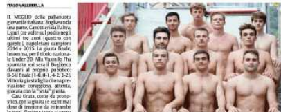
La formazione del Bogliasco Under 20 campione d'Italia 2017

Il sogno si avvera: i padroni di casa battono 8-5 la Canottieri in finale