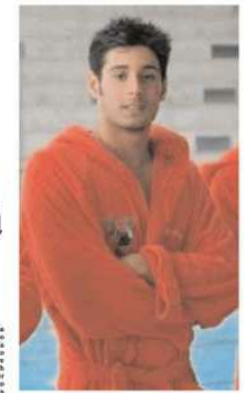
Il centroboia di Posillipo è a caccia di spazio in vasca del torneo di Budapest

L' Italia, campione iridata a Shan gai nel 2011, si è classificata al quarto posto nelle ultime edizioni e, dopo il terzo posto delle Olimpiadi brasiliane, sarà chiamata a confermare lo stato di crescita del proprio gruppo.