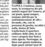
NAPOLI. Continua, senza sosta, la scomparsa dei più antichi negozi del Vomero, ai cui posti, quasi sempre, sorgono attività per la sanificazione delle città e bevande, che, con la presenza di garbo, tavolini e sedie, hanno di fatto trasformato il quartiere calcinacci della città, da un vero e proprio fast food a cielo aperto. Purtroppo, in linea con questa tendenza, dopo quasi settant'anni di vita, in questi giorni ha chiuso un altro negozio che per molti ha rappresentato un pezzo di storia del quartiere, il negozio di antiquariato della ditta Serrano, presente dal 1958, nella

«È un accordo importante, suggellato dall' ok che ci ha dato l' Anac» ha detto il commissario straordinario per le Universiadi, Gianluca Basile, a margine della firma dell' accordo di collaborazione con l' Autorità di Sistema Portuale del Mar Tirreno centrale di Napoli presieduta da Pietro Spirito.