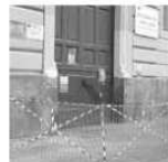
ma anche recentemente, interessando dal distacco di intonaci e pezzi di cornice. Per questo i residenti chiedono di riappare immediatamente le condizioni più sicure.

Il vento forte di qualche giorno fa ha fatto volare la rete di contenimento, e con ulteriori ammontamenti non è riuscito a trattenere i calcinacci che sono finiti per strada.