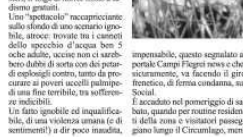
Se amatori si dedicano a fare jogging...

Se amatori si dedicano a fare jogging, sono stati loro ad accorgersi, con l'arabesco mai potuto immaginare, della tremenda fine di questi poveri animali, almeno 5 persone di occhio hanno fatto il viaggio in aereo sulla splendida spiaggia di Apollo.