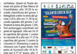
monia di premiazione conclusiva dell'evento, domenica alle 13.30 nel piazzale del porto di Acciaroli.

stellabate. Quarti di finale domani nel porto di San Marco di Castellabate: alle 10.30 la seconda classificata del girone 1 batterà la terza del girone 2 (G); alle ore 11.30 la seconda squadra del girone 2 affronterà la terza del girone 1 (H). Nel pomeriggio semifinali nel porto di Agropoli. Alle ore 16.15 la capolista del girone 1 contro la vincente H e alle ore 17.15 la capolista del girone 2 contro la vincente G. Domenica ci sarà la chiusura con il gran finale. Nel porto di Acciaroli alle 10 la finale per il 5°-6° posto, alle 11 finalina per il gradino più basso del podio (3°-4° posto), alle 12 si stabilirà il vincitore della kermesse. In caso di parità si procederà con i tiri di rigore. Cer-