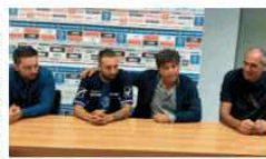
Il tavolo della conferenza stampa di ieri