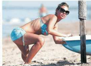
Yoga sul mare.

La sfida La sfida è un momento molto importante per tutti. È un momento molto importante per tutti. È un momento molto importante per tutti.