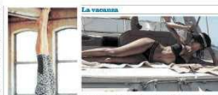
La Ghalichi a Ravello, star dei social media

Il relax A tutto yoga: corsi al mare per eliminare stress e tossine In forma come Blasi e Canalis: nuove tecniche in Costiera