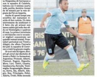
Mela foto di Roberto Rucellai/Foto: Lauric - mondo nel Savona

Un golzone di Fici ha deciso il derby più atteso