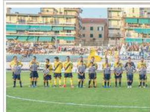
Il Savona, qui prima del test con il Genoa, si prepara in campo nel pomeriggio a Calce contro il Brixia