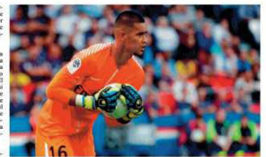
Alphonse Areola è il portiere del PSG che piace molto ad Ancelotti