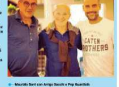
Maurizio Sarri con Arrigo Sacchi e Pep Guardiola

di contratto e c'è una penale che blocca il club di Stamford Bridge. Secondo l'Evening Standard resta ancora in piedi l'ipotesi Maurizio Sarri, anche se il tecnico toscano è ancora contrattualmente legato al Napoli nonostante l'arrivo di Carlo Ancelotti sulla panchina degli azzurri. Per il tabloid britannico c'è anche la soluzione Laurent Blanc, ma in realtà in pole ci sarebbe il manager del Fulham, Slavisa Jokanovic, protagonista del ritorno in Premier di una squadra che ha anche espresso un ottimo calcio. Il club di Craven Cottage vuole rinnovare il contratto, ma la firma non sarebbe ancora arrivata e il Chelsea ci sta facendo un pensierino, anche perché il 49enne ex difensore serbo conosce bene l'ambiente per aver militato due stagioni nel club londinese.