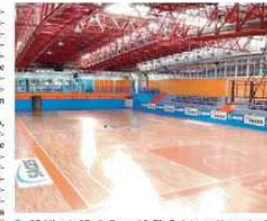
Il PalaCaravita di Pisciardi, casa della Dike Basket a ore 19:00 per i lavori