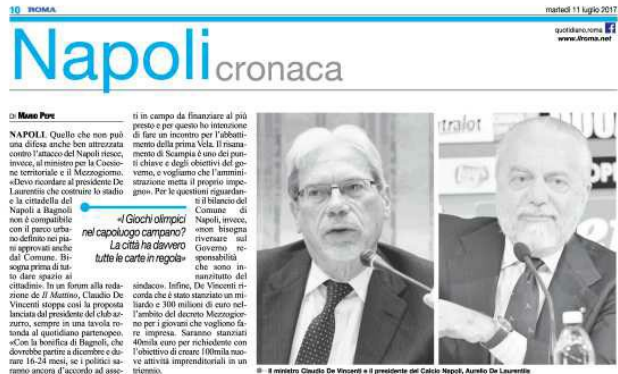
Il ministro Graziano De Luca e il presidente del Calcio Napoli, Aurelio De Laurentiis

L'intesa finale non c'è ancora ma sembra che siamo sulla strada giusta. Con il Governo c'è un dialogo importante che può condurre ad un'intesa storica ma fino a quando non ci saranno le firme del Governo, della Regione Campania e della città di Napoli posso solo essere contento del metodo di lavoro utilizzato, della capacità di ascolto e della correttezza che poi si devono tradurre nell'accordo». Due parole anche sull'incontro con il ministro dei Trasporti e delle Infrastrutture, Graziano Delrio: «Dovremmo avere un Cipe a luglio con cui si chiude tutto il finanziamento per la linea 1 e la linea 6 della