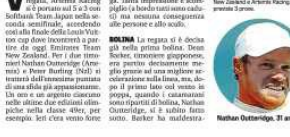
Artemis, la barca svedese che si batte per la vittoria.

Lo scafo svedese recupera da i-3 su Team Japan che prima del via urla una tartaruga