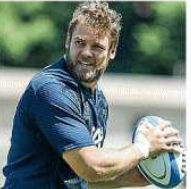
Ryan Lochte, 30 anni, si presenta a 4 mesi quasi anno