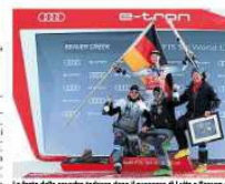
La festa della squadra tedesca dopo il successo di Luitz a Beaver

Una volta che il caso di doping di Luitz è stato confermato, la Federazione internazionale di sci alpino (Fis) ha confermato che il campione austriaco è stato squalificato. La decisione è stata annunciata in un comunicato stampa. Luitz, 34 anni, è stato squalificato per un periodo di due anni e sei mesi. La decisione è stata annunciata il 22 dicembre. Al momento Luitz è ancora in carcere. Il suo avvocato ha chiesto la sua liberazione. La Fis ha detto che il campione austriaco è stato squalificato per un periodo di due anni e sei mesi. La decisione è stata annunciata il 22 dicembre. Al momento Luitz è ancora in carcere. Il suo avvocato ha chiesto la sua liberazione.