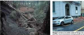
Da oggi, i lavori sulla costa di Napoli che erano stati sospesi. In basso, dopo l'ennesimo cedimento in via Crispi, il traffico è bloccato