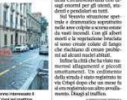
Da oggi, i lavori sulla costa di Napoli che erano stati sospesi. In basso, dopo l'ennesimo cedimento in via Crispi, il traffico è bloccato