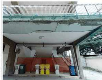
Capitolo Provenienze su alcuni lati della Collana che rischia di cedere. Visti di proposito per evitare incidenti