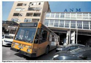
Bus di Napoli. In alto: i documenti inviati alla Motorizzazione Civile di Napoli per i 173 autisti che non possono più guidare i bus

Pagine di firma dell'Anm sugli elenchi di busisti inabili a rinnovare la patente. La lista dei nomi è stata inviata alla Motorizzazione Civile di Napoli l'11 ottobre del 2017. In base a quella, i busisti non possono più guidare i veicoli. Per chi non ha ancora rinnovato la patente, il Comune di Napoli ha inviato una lettera di diffida a rinnovarla entro il 15 novembre. Se non lo fa, il Comune di Napoli ha il dovere di revocare la patente. Il sindaco Luigi de Magistris, che ha firmato la lettera, ha detto: «È un atto di responsabilità che il Comune di Napoli deve assumere».