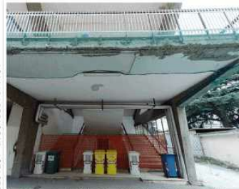
Copertura (in alto) e tribuna (in basso) del Collana che rischiano di cedere nel disastro per un grave incendio

Corriere del Mezzogiorno | Martedì 8 novembre 2017