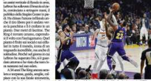
LeBron James, 34 anni, ha superato Michael Jordan (32.292 punti) nella NBA.

«Averlo superato lo metto allo stesso livello di un titolo. Quando ero ragazzo volevo essere lui». LeBron James ha superato il record di punti di Michael Jordan (32.292) nella NBA. LeBron James ha superato il record di punti di Michael Jordan (32.292) nella NBA. LeBron James ha superato il record di punti di Michael Jordan (32.292) nella NBA.