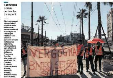
I trasporti, l'odissea Comune e impresa litigano via Marina resta incompiuta

Coni, nasce il team degli «Olimpionici per le Universiadi». Il team è formato da atleti campani che hanno vinto medaglie olimpiche e si impegneranno per promuovere lo sport e il modello di vita che lo circonda.