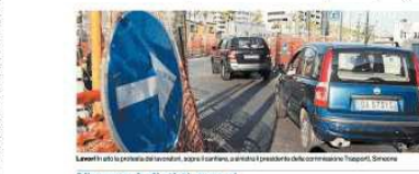
Lavori alla prova del secondo anno. In alto: il cantiere aerea di Capri. In basso: il cantiere di Capri. In alto: il cantiere aerea di Capri. In basso: il cantiere di Capri.

Slitta ancora l'inaugurazione del nuovo tratto prevista per luglio