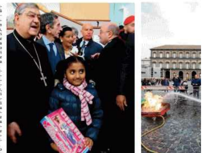
grazie al quale i migranti potranno realizzare lavori socialmente utili, ad esempio anche alla Regina di Caserta e al servizio di Pompei, in tutti quei luoghi simbolo del turismo in Campania. Le città nella nostra regione con-

A metà dicembre dello scorso anno, alla presenza del ministro dell'Interno Marco Minniti, ci fu la firma al Maschio Angioino del protocollo d'intesa con dieci associazioni di sindacati dei Comuni della regione Campania, un progetto finalizzato al miglioramento del sistema di accoglienza dei richiedenti asilo e grazie al quale i migranti potranno realizzare lavori socialmente utili, ad esempio anche alla Regina di Caserta e al servizio di Pompei, in tutti quei luoghi simbolo del turismo in Campania. Le città nella nostra regione con-