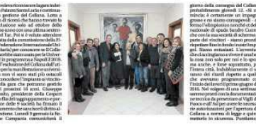
Gruppo di lavoro per la gestione del Collana