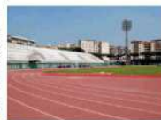
Uno scorcio dello stadio Collana

NAPOLI. È finalmente arrivata ieri l'attesa firma del contratto di gestione e riqualificazione dello stadio Collana, tra la Regione Campania e l'Ati Collana, società vincitrice del bando e che comprende nove diverse realtà dello sport napoletano. L'Ati Collana si era aggiudicata da tempo la gara per l'assegnazione dello stadio vomerese; poi però, tra ricorsi al Tar (puntualmente respinti dal Tribunale Amministrativo Regionale) e ritardi da parte del Comune di Napoli nel liberare la struttura, i tempi si sono allungati a dismisura, tanto da far a più riprese sbottare il presidente di Ati, l'olimpionico San