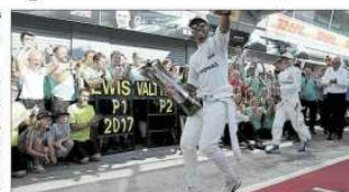
Lewis Hamilton sul podio a Monza.

Il giocatore italiano ha avuto una performance eccezionale durante la partita, ma non è riuscito a segnare. Il giocatore ha concluso la partita con un 10° posto, che è il suo miglior risultato in carriera.