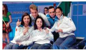
Le sciaboliatrici azzurre con la medaglia di bronzo a Varsavia

IL PERCORSO. Si tratta del primo podio per le sciaboliatrici azzurre, che nella fantascopia sono riuscite a superare la Russia per 45-44 nella finale valida per il terzo posto. La squadra azzurra, dopo aver vinto per 45-26 ai quarti di finale contro la Grecia, è stata fermata in semifinale dall'Ucraina col punteggio di 45-30. Poi è giunta la mancata occasione del 45-44 contro la Russia, che ha portato le ragazze italiane a festeggiare. Il titolo è andato