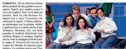
Le sciabolatrici azzurre con la medaglia di bronzo a Varsavia

alle ragazze cinesi, che in finale hanno superato la stessa Ucraina per 45-33.