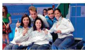
Le sciatribolte azzurre con la medaglia di bronzo a Varsavia

IL PERCORSO. Si tratta del primo podio per le sciatribolte azzurre, che nella fattispecie sono riuscite a superare la Russia per 45-44 nella finale valida per il terzo posto. La squadra azzurra, dopo aver vinto per 45-26 ai quarti di finale contro la Grecia, è stata fermata in semifinale dall'Ucraina col punteggio di 45-30. Poi è giunta la nicchia decisiva del 45-44 contro la Russia, che ha portato le ragazze italiane a festeggiare: il titolo è andato