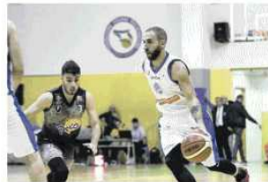
EMM A Casertano match equilibrate Caserta ha vinto solo al supplementare