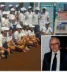
La foto di rito in piazzetta. Nel riquadro il sindaco di Capri De Martino