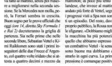
Hamilton, di poco più lento il finlandese, che invece al mattino era stato più forte di Vettel, seguito da i progressi visti a Spa sono stati un episodio. Del resto, davanti al proprio pubblico, la Rossa non vuol sfigurare. «Dobbiamo migliorare la macchina ma più potenziale di quello che abbiamo espresso - dice un combattivo Vettel - le sensazioni sono buone ma dobbiamo dimostrare in ogni curva. La prima impressione è comunque positiva».

MONZA. Nel giorno in cui arriva la semifinale dell' accordo per mantenere il Gran Premio d'Italia a Monza fino al 2019, le indicazioni che arrivano dalla libreria dei venerdì vedono le "belle" Mercedes davanti a tutto. Il più veloce di giornata è Lewis Hamilton, grazie all'1'27"001 segnato nel pomeriggio, di poco più di un decimo e mezzo inferiore al giro che il compagno di squadra aveva fatto al mattino, senza poi riuscire a migliorarsi nella seconda sessione. Se la Mercedes non molla, però, la Ferrari sembra in crescita. Buon segno per le previsioni di oggi (ore 14, diretta Sky Formula 1 e Rai 2) decrittano la griglia di partenza. Sia nelle prime che nelle seconde libere, Sebastian Vettel e Kimi Raikkonen sono stati i primi investigatori delle due F105 di Agip, con quattro volte in più che si attesta a quattro decimi e mezzo da