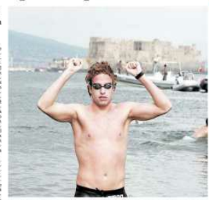
Sull'isola Primo test per il 28 agosto

Una stagione in poco più di un mese al largo. La Capri-Napoli, con una maratona che si svolgerà il 4 settembre, è stata la prima di una serie di gare che si svolgeranno in un arco di tempo che va dal 4 settembre al 10 ottobre. Una maratona che si svolgerà in un arco di tempo che va dal 4 settembre al 10 ottobre. Una maratona che si svolgerà in un arco di tempo che va dal 4 settembre al 10 ottobre.