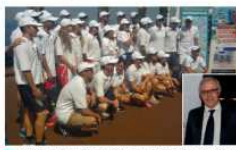
La foto di rito in piazzetta. Nel riquadro il sindaco di Capri De Martino

NAPOLI. Ieri giornata di allenamento ma anche di relax per i 28 nuotatori che domenica prenderanno parte alla 51esima edizione della Capri-Napoli trofeo supermercati Piccolo, gara di nuoto di fondo riservata alle prove superiori ai 10 chilometri. Infatti saranno 36 i chilometri da percorrere con partenza, alle ore 10, dal Lido Ondine di Marina Grande di Capri, ed arrivo previsto per le 15,30-16.00 presso il Circolo Canottieri Napoli. Atleti, tecnici e componenti dello staff organizzativo sono giunti in mattinata, grazie ai mezzi messi loro a disposizione della Navigazione Libera del Golfo, a Capri. I nuotatori sono stati ricevuti in Comune dal sindaco Giovanni De Martino, che ha annunciato la propria presenza alla partenza di domenica.