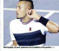
Nadal Kyrgios, 23 anni, polacco con il pubblico in una partita...

Il primo set, Nadal era il che spazza via Kyrgios in un colpo solo nel primo set. Il secondo set, Nadal è stato più generoso e ha lasciato il match non finito. Ma il match non è finito lì. Kyrgios è stato durissimo con Nadal, e ha detto che è un grande. Nadal è stato durissimo con Kyrgios, e ha detto che è un grande. Il match è stato un show, e ha fatto molto parlare. Nadal è stato durissimo con Kyrgios, e ha detto che è un grande. Kyrgios è stato durissimo con Nadal, e ha detto che è un grande.